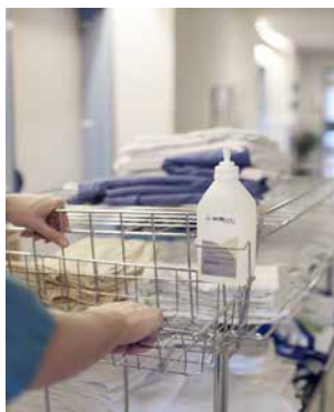
Festet til mobile traller og arbeidsbord