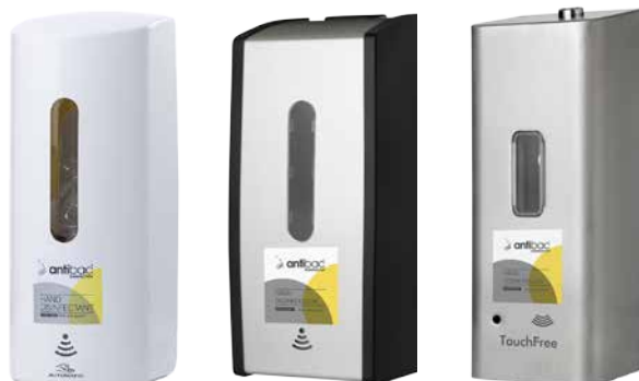
Antibac® berøringsfrie dispensere

Vi anbefaler også gode rutiner for desinfisering av hyppige berørte kontaktpunkter med Antibac® Overflatedesinfeksjon. Se vårt sortiment på www.antibac.no