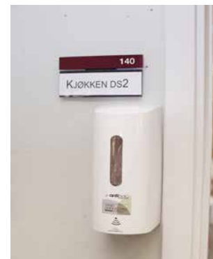
På utsiden av rene lager og kjøkken