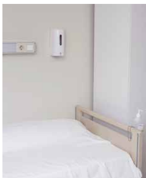
Innen armlengdes avstand fra hver pasient-/beboerseng (maks 1 m)