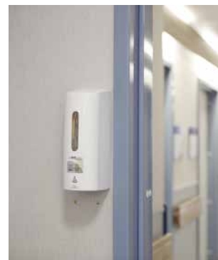
På utsiden av hvert pasient-/beboerrom og avdeling