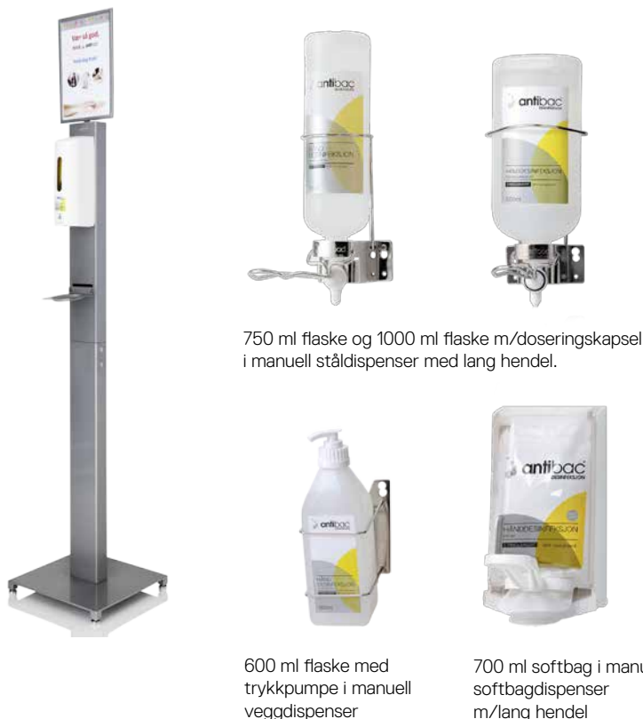
750 ml flaske og 1000 ml flaske m/doseringskapsel i manuell ståldispenser med lang hendel.