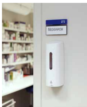
I høyaktivitetsområder som bl.a. medisinrom, arbeidsrom, fellesstuer, matsaler, resepsjonsområder osv.